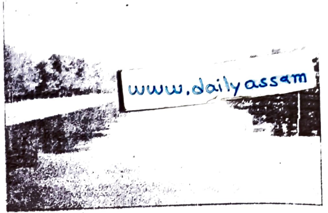
চিত্ৰ ৯.৩ : ইন্দিৰা গান্ধী খাল

পৰিবেশিক সমস্যাৰাজিৰ ওপৰত পৃথিবীব্যাপি সৃষ্টি হোৱা মতৰ প্ৰতি সঁহাৰি জনাই, সংযুক্ত ৰাষ্ট্ৰই, নৰেৰেৰ প্ৰধান মন্ত্ৰী গ্ৰো হাৰলেম, ব্ৰুন্টলেণ্ডৰ (Gro Harlem Brundtland) অধিনায়কত্বত, বিশ্ব পৰিবেশ আৰু উন্নয়ন' শিবোনামাৰে এখন আয়োগৰ (World Commission of Environment and Development/ WCED) গঠন কৰে। ১৯৮৭ চনত আয়োগে 'আমাৰ উমৈহতীয়া ভৱিষ্যৎ' (Our Common Future) শিবোনামাৰে এখন প্ৰতিবেদন দাখিল কৰে। এই প্ৰতিবেদনখনক 'ব্ৰুন্টলেণ্ডৰ প্ৰতিবেদন বুলিও জানিব পাৰি। প্ৰতিবেদনখনে ধাৰণক্ষম উন্নয়নৰ সংজ্ঞা এনেধৰণে দিয়ে— 'আমাৰ ভৱিষ্যৎ প্ৰজন্মৰ প্ৰয়োজন পূৰণ কোনো প্ৰকাৰে বাধাগ্ৰস্ত নোহোৱা পৰিসৰত বৰ্তমানৰ অভাৱ পূৰণ সীমাবদ্ধ ৰখা পৰ্যায়ৰ উন্নয়নেই ধাৰণক্ষম উন্নয়ন? ('Development that meets the needs of the present without compromising the ability of future generations to meet their own needs.')