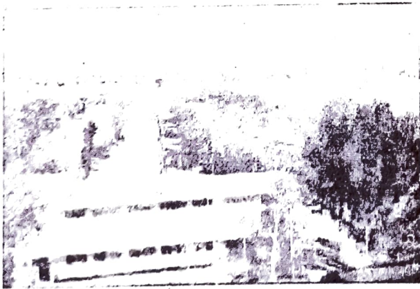
চিত্ৰ ৯.৪ : ইন্দিৰা গান্ধী খাল আৰু দাঁতিকাষৰীয়া অঞ্চল