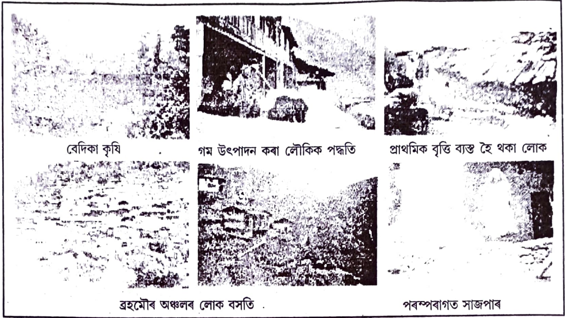
চিত্ৰ ৯.১ : ব্ৰহ্মোৱৰ জনজাতীয় অঞ্চল

১৯৭৪ চনত পঞ্চমবাৰ্ষিক পৰিকল্পনাৰ অধীনত হাতত লোৱা একত্ৰ জনজাতি উন্নয়নৰ সৰ্বমুঠ ৫টা প্ৰকল্পৰ অন্যতম প্ৰকল্প ক্ষেত্ৰ হিচাপে হিমাচল প্ৰদেশৰ এই ব্ৰহ্মোৱৰ এলেকাটো বাছনিত উঠে। গান্ধীসকলৰ জীৱন-যাপনৰ মান উন্নত কৰাৰ লগতে ৰাজ্যখনৰ অন্যান্য অঞ্চলৰ উন্নয়নৰ সমসূৰী পৰ্যায়লৈ বৃদ্ধি কৰাই প্ৰকল্পটোৰ মুখ্য উদ্দেশ্য আছিল। এই উদ্দেশ্যে এই প্ৰকল্পৰ অধীনত অঞ্চলটোৰ কৃষি, যাতায়াত আৰু আন কিছুমান সেৱামূলক কাৰ্যক্ৰমৰ মান উন্নত কৰাৰ প্ৰতি বিশেষ মনোযোগ দিয়া হৈছিল। অঞ্চলটোৰ শিক্ষা, স্বাস্থ্য, বাট-পথ, বিজুলীৰ যোগান, যোগাযোগ প্ৰভৃতি ভালেমান সেৱাৰ উন্নতি হৈছিল। কিন্তু ইয়াৰ মাজতেই দেখা গ'ল যে অঞ্চলটোৰ নদীপৰীয়া অৱস্থানসমূহত হোৱা উন্নয়নৰ তুলনাত ভিতৰুৱা ভালেমান ঠাইত এনেবোৰ উন্নয়ন কাৰ্যক্ৰমে স্পৰ্শ কৰিব পৰা নাই।