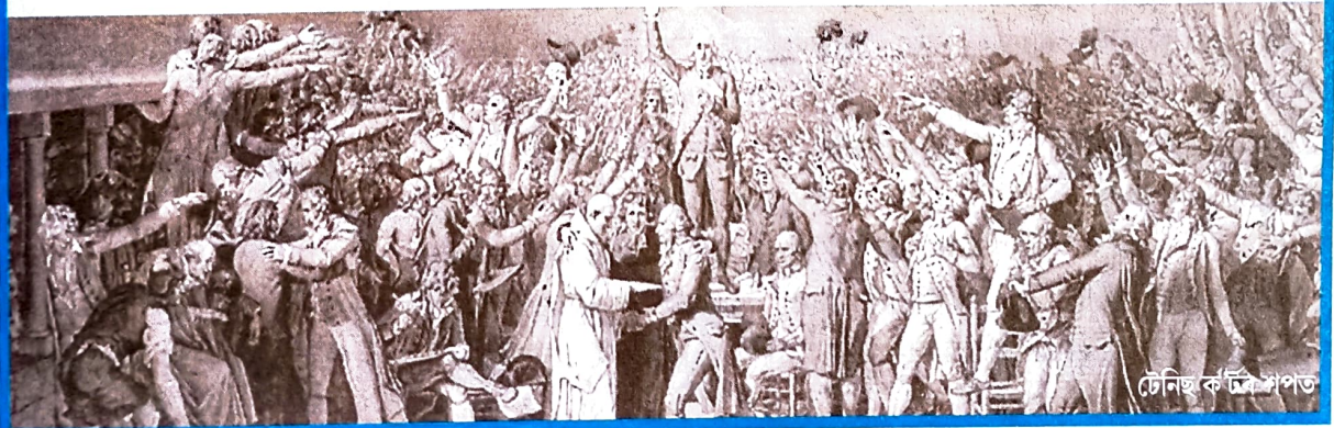
টেনিছ ক'ৰ্টৰ পত

Constituent Assembly Debates (CAD) Vol. 1