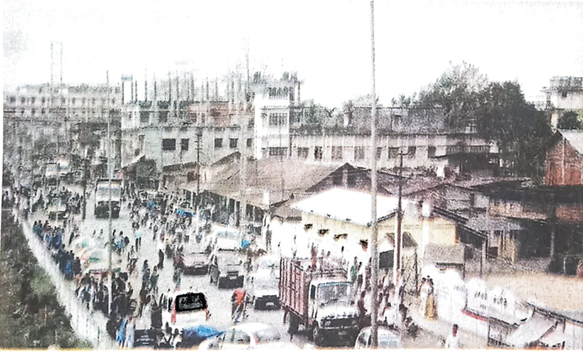
চিত্ৰ 8.1 নগৰৰ ব্যস্ত অঞ্চল

নগৰীয়া বসতি সাধাৰণতে ব্যৱসায়-বাণিজ্য, শিল্প-উদ্যোগ আদিক কেন্দ্ৰ কৰি গঢ় লৈ উঠে। নগৰত প্ৰায় ৭৫ শতাংশ বা ততোধিক লোকে উদ্যোগ, বাণিজ্য আৰু বিভিন্ন সেৱামূলক কাৰ্যৰ লগত জড়িত হৈ জীৱন নিৰ্বাহ কৰে। নগৰৰ কেন্দ্ৰীয় অঞ্চলটো ব্যৱসায়-বাণিজ্যৰ কেন্দ্ৰবিন্দু। ইয়াত বেংক, পাইকাৰী আৰু খুচুৰা বিক্ৰী কেন্দ্ৰ, বিভিন্ন প্ৰকাৰৰ ব্যৱসায়িক প্ৰতিষ্ঠান আদি থাকে। নগৰৰ কেন্দ্ৰৰ আশে-পাশে বিভিন্ন ধৰণৰ কাৰ্যালয়, শিক্ষানুষ্ঠান, উদ্যোগ আদি গঢ়ি উঠে। এই অনুষ্ঠানবোৰৰ লগত নগৰৰ মানুহৰ জীৱিকা আৰু বিভিন্ন কাম-কাজ সংযুক্ত হৈ থাকে। নগৰত যিমানৈ জনসংখ্যা বৃদ্ধি হয় সিমানৈই ঠাইৰ নাটনি হয়। জনসংখ্যা বৃদ্ধিৰ ফলত নগৰত সকলো ধৰণৰ প্ৰয়োজনীয় সামগ্ৰীৰ চাহিদা বৃদ্ধি পায়। ফলত কিছুমান বস্তুৰ দামো বাঢ়ে। অধিক উপাৰ্জনৰ স্বার্থত নগৰীয়া মানুহে বিভিন্ন কাম-কাজত ব্যস্ত থাকিবলৈ বাধ্য হয়। নগৰত শিক্ষা, চিকিৎসা আদিৰ সা-সুবিধা বেছি। যাতায়াতৰ ব্যৱস্থাও সুচল। ইয়াত