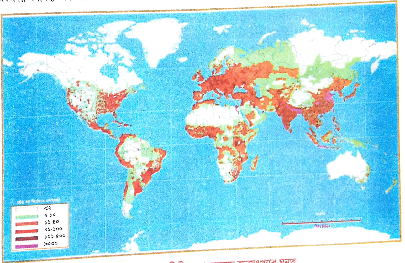
চিত্ৰ ২.২ পৃথিৱীৰ অঞ্চলভেদে জনসংখ্যাৰ ঘনত্ব

জনসংখ্যাৰ ঘনত্ব অঞ্চলভেদে বেলেগ হোৱা দেখা যায়। আমেৰিকা যুক্তৰাষ্ট্ৰৰ উত্তৰ-পূৰ্বাঞ্চল, পশ্চিম আৰু মধ্য ইউৰোপৰ দেশসমূহ, দক্ষিণ আৰু দক্ষিণ-পূব এছিয়াৰ দেশবোৰৰ জনসংখ্যাৰ ঘনত্ব প্ৰতি বৰ্গ কিলোমিটাৰত ২০০ জনৰো অধিক। আনহাতে উপমহাদেশীয় গ্ৰীণলেণ্ড, তুৱা অঞ্চল, উপক্ৰান্তীয় মৰুভূমি অঞ্চল, দক্ষিণ আমেৰিকাৰ নিৰক্ষীয় বৰ্ষাৰণ্য অঞ্চলত জনসংখ্যাৰ ঘনত্ব প্ৰতি বৰ্গ কিলোমিটাৰত এজনতকৈ কম।