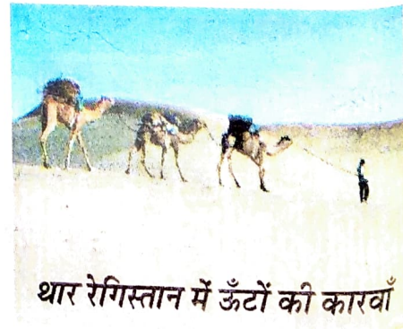
थार रेगिस्तान में ऊँटों की कारवाँ

पर्यटन के संदर्भ में राजस्थान का एक और महत्वपूर्ण आकर्षण है जैसलमेर शहर। अपनी यात्रा का असली आनंद तो हमने यहीं उठाया। यहाँ हमने देखा कि शहर के सारे प्राचीन भवन पीले-भूरे रंग के पत्थरों से बने हैं। इसीलिए यह शहर राजस्थान का 'स्वर्ण शहर' भी कहलाता है। यह क्षेत्र विशाल थार मरुस्थल का एक बड़ा भाग है जिसके कारण यहाँ केवल रेत ही रेत दिखाई देता है। पूरे इलाके में विभिन्न आकार-प्रकार के बालू के ऊँचे-ऊँचे टीलों का विशाल सागर-सा दिखाई देता है। रेत के टीलों का यह अथाह सागर राजस्थान का असल अहसास कराता है। सूर्यास्त के समय यहाँ काफी खूबसूरत नजारा होता है। इस विशाल रेगिस्तान में सभी पर्यटक ऊँट की सवारी का आनंद अवश्य उठाते हैं। हमने भी