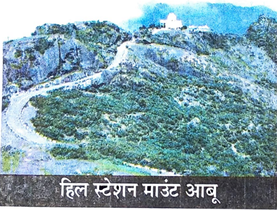
हिल स्टेशन माउंट आबू

इसके बाद हम राजस्थान के हिल स्टेशन माउंट आबू पर