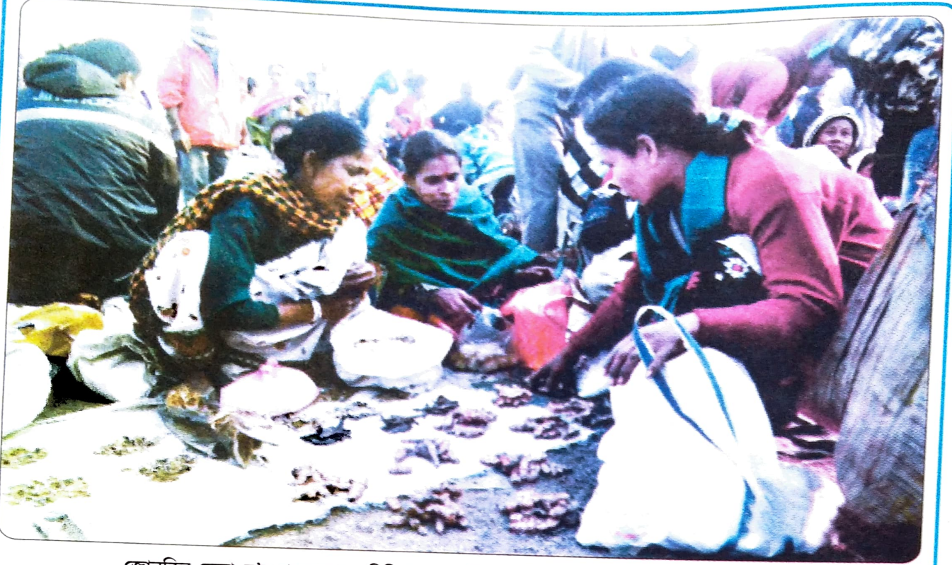
জোনবিল মেলা, য'ত পৰস্পৰাগত বিনিময় প্ৰথা একৈশ শতিকাৰ আধুনিক যুগতো অব্যাহত আছে।

কুঁহিয়াৰৰ বিনিময়ত 'ক'ৰপৰা ধানৰ এক অংশ সংগ্ৰহ কৰিব। 'ক' আৰু 'খ' কোনোৱেই আত্মনিৰ্ভৰশীল নহয়; তেওঁলোক দুয়ো পৰস্পৰ নিৰ্ভৰশীল। সামগ্ৰীৰ সলনি সামগ্ৰীৰ পোনপটীয়া বিনিময় কৰি দুয়ো দুয়োৰে অভাৱ পূৰণ কৰিছে।