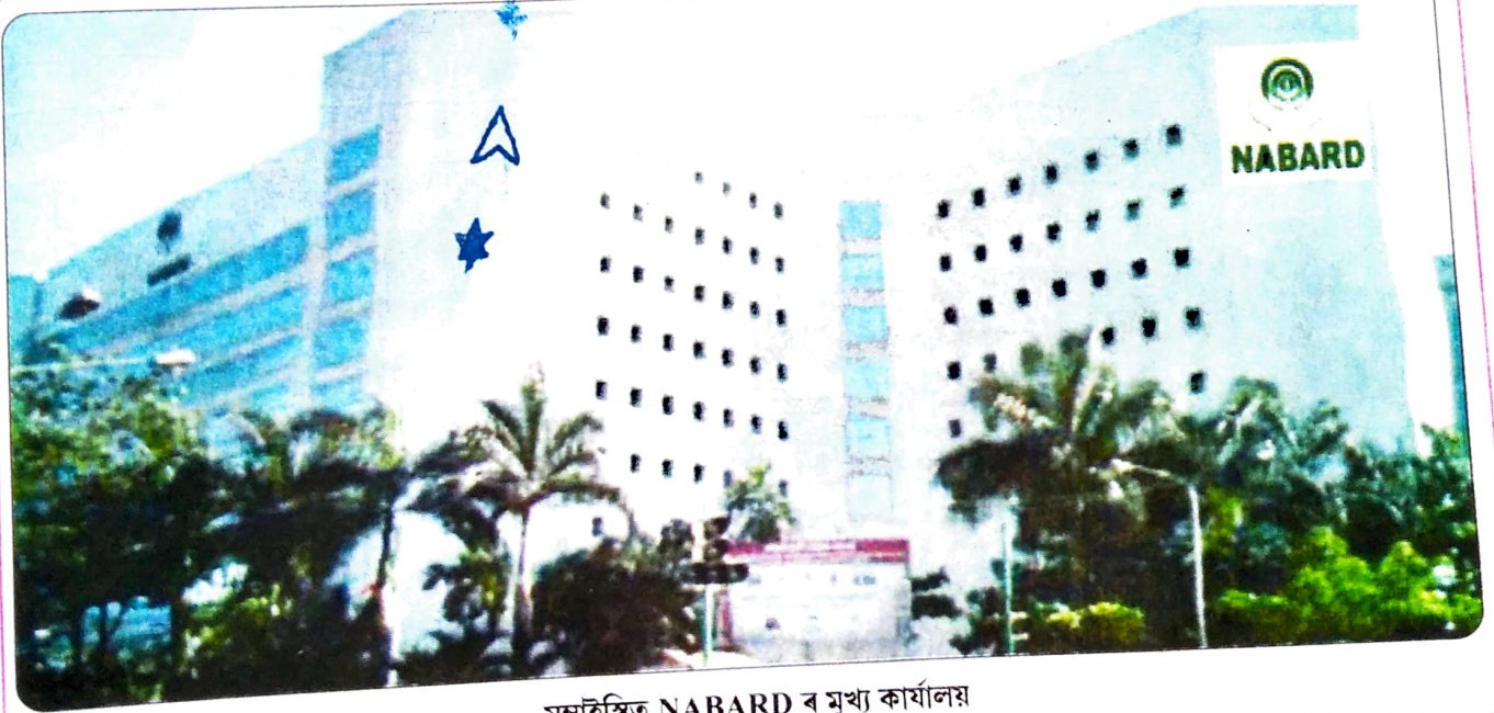
মুম্বাইস্থিত NABARD ৰ মুখ্য কাৰ্যালয়

(৬) ভাৰতীয় ক্ষুদ্ৰ উদ্যোগ উন্নয়ন বেংক (Small Industries Development Bank of India বা SIDBI) :