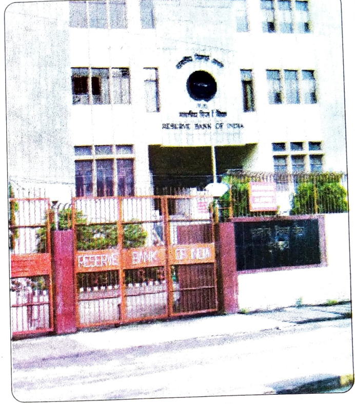
ভাৰতীয় ৰিজাৰ্ভ বেংকৰ মুম্বাইস্থিত মুখ্য কাৰ্যালয় আৰু গুৱাহাটী শাখা কাৰ্যালয়ৰ ছবি।

২৮ কেন্দ্ৰীয় বেংকে আমানত মুদ্ৰা বা ঋণ মুদ্ৰাৰ পৰিমাণ নিয়ন্ত্ৰণ কৰে। এই মুদ্ৰা দেশৰ সৰ্বমুঠ মুদ্ৰাৰ এক বৃহৎ অংশ। বাণিজ্যিক বেংকসমূহৰ ঋণদান ক্ষমতাৰ ওপৰত আমানত মুদ্ৰা বা ঋণ মুদ্ৰাৰ পৰিমাণ নিৰ্ভৰ কৰে। কেন্দ্ৰীয় বেংকে ঋণ নিয়ন্ত্ৰণ ব্যৱস্থাপন কৰি বাণিজ্যিক বেংকসমূহৰ ঋণ প্ৰদান ক্ষমতা নিয়ন্ত্ৰণ কৰিব পাৰে।