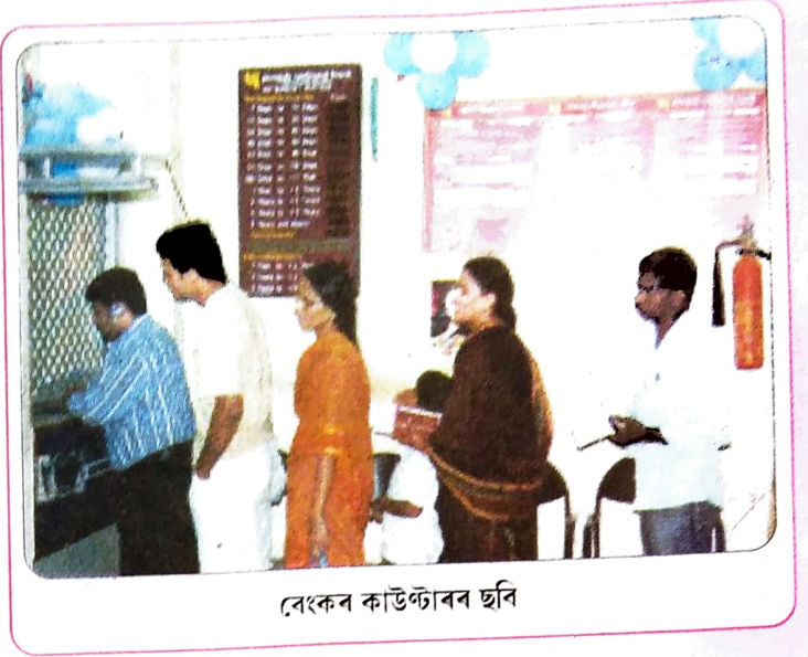
বেংকৰ কাউণ্টাৰৰ ছবি

যিকোনো সময়তে চেকৰ যোগেদি উলিয়াই আনিব পাৰে। স্থিৰ বা কাল আমানতৰ ক্ষেত্ৰত এনে কৰিব নোৱাৰি। এই আমানত উলিয়াই আনিবলৈ হ'লে আমানতকাৰীয়ে বেংকক আগতীয়াকৈ জনাব লাগিব। সঞ্চয় আমানতৰ ক্ষেত্ৰত জমাৰ এটা অংশ আমানতকাৰীয়ে প্ৰয়োজন অনুসৰি উলিয়াই আনিব পাৰিব কিন্তু আনটো অংশ উলিয়াবলৈ হ'লে বেংকৰ আগতীয়া অনুমতিৰ প্ৰয়োজন হ'ব।